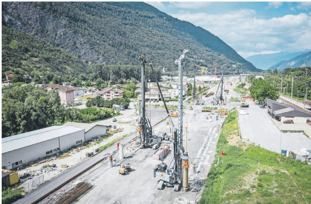
Grossbaustelle. In Raron ist eine der grössten Baustellen des Wallis in Betrieb.

Bereits seit März 2018 ist die Baustelle in Betrieb. Seither und noch in den nächsten zwölf Monaten gilt es, die Baugrube vor dem Grundwasser zu schützen. Denn die Arbeiten am gedeckten Einschnitt führen bis zu 24 Meter unter den Boden. Damit die Baustelle nicht einstürzt, wird sie mit Bohrpfählen geschützt, in die Beton eingegossen wird. Dabei entsteht eine lückenlose Wand aus Beton, die 1460 Meter lang, 1,3 Meter dick und 24 Meter tief ist. Erst danach kann es losgehen mit dem Aushub und dem Betonieren der Tunnelanlage. | Seiten 6 und 7