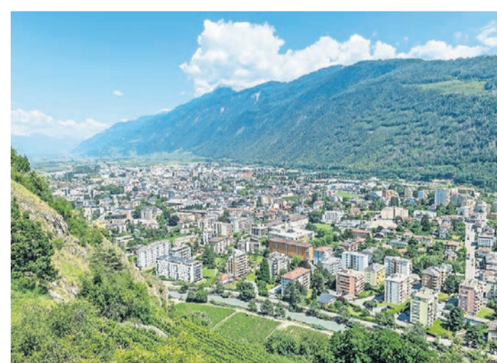
Ausserplanmässig. Die Stadt Martinach erbt von einer Verstorbenen 20 Millionen Franken.